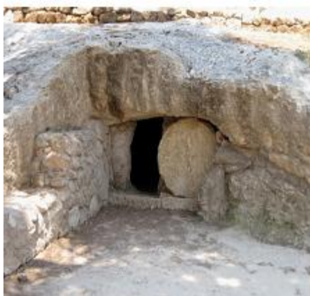
上圖：拿撒勒村鑿在磐石裡的墳墓。

b) 至今在耶路撒冷可見在山壁磐石裡鑿的墳墓，有的墳墓裡不止一個室，室壁上各有數個壁龕，可安放多具屍體，不過入口只有一個，外面有一個凹槽，可以滾過一塊大石頭擋在墓口。