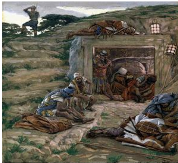
The Watch Over the Tomb by James Tissot

【但以理書 6:17 有人搬石頭放在坑口、王用自己的璽、和大臣的印、封閉那坑、使懲辦但以理的事、毫無更改。】