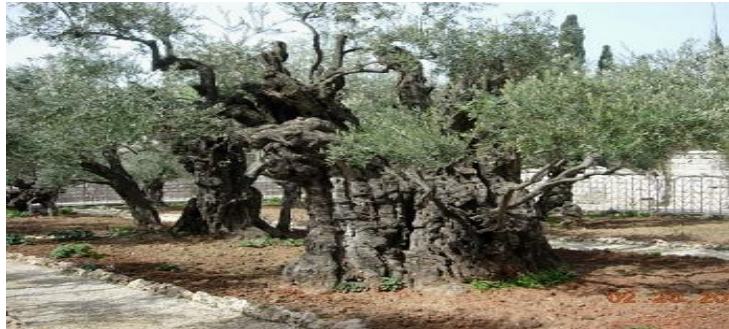
上圖：客西馬尼園現在有八棵巨大的橄欖樹，可能在主耶穌的時代就已經存在了。

【約翰福音 16:7 然而我將真情告訴你們，我去是與你們有益的，我若不去，保惠師就到不了你們這裏來，我若去，就差他來。】