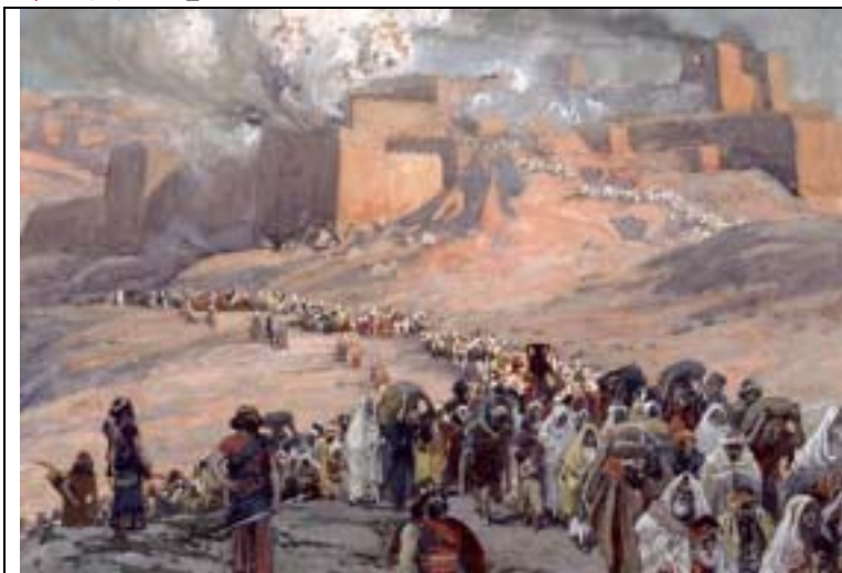
主前 586 年『耶路撒冷』陷落、猶大被擄。

【耶利米書 52:30 尼布甲尼撒二十三年、護衛長尼布撒拉旦擄去猶大人七百四十五名。共有四千六百人。】