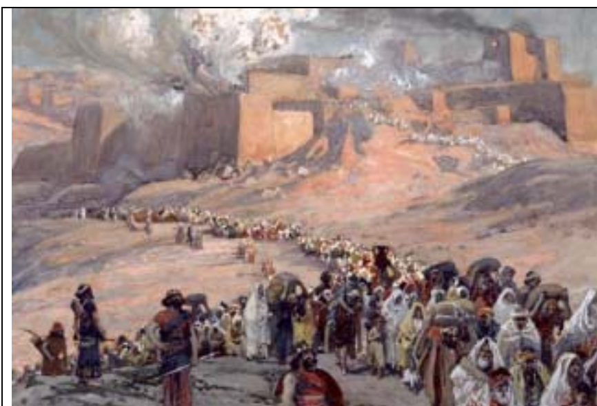
主前 586 年『耶路撒冷』陷落、猶大被擄。

18) 不久，『尼布甲尼撒』二世再次率新『巴比倫』軍隊對『耶路撒冷』發動圍攻。這次的圍攻歷時 18 個月。由於饑荒和內部分裂，『耶路撒冷』終於在主前 586 年陷落。