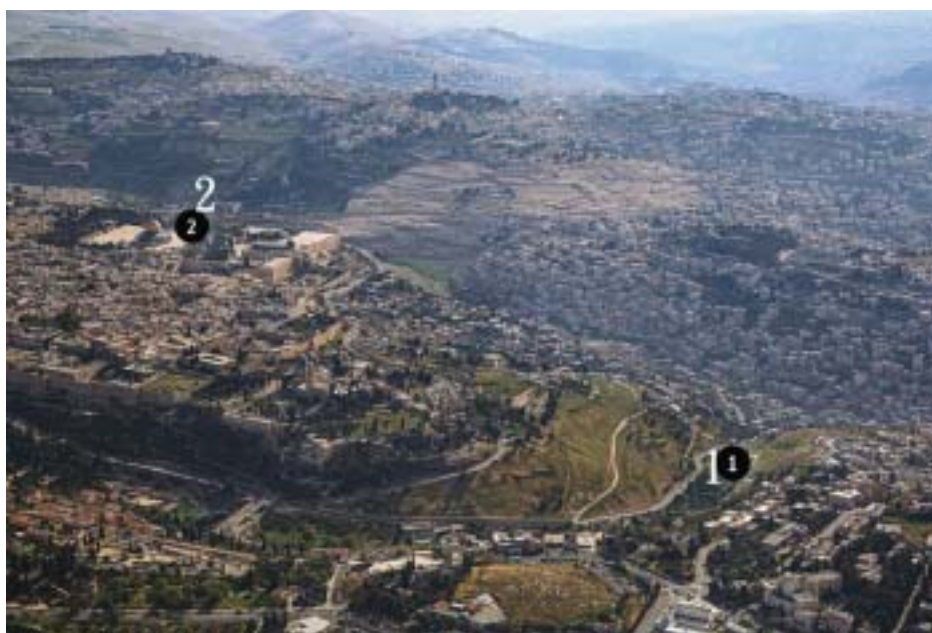
(1)是欣嫩子谷，(2)是聖殿山，即原來聖殿的位置。

【歷代志下 28:3 並且在欣嫩子谷燒香、用火焚燒他的兒女、行耶和華在以色列人面前所驅逐的外邦人那可憎的事。】